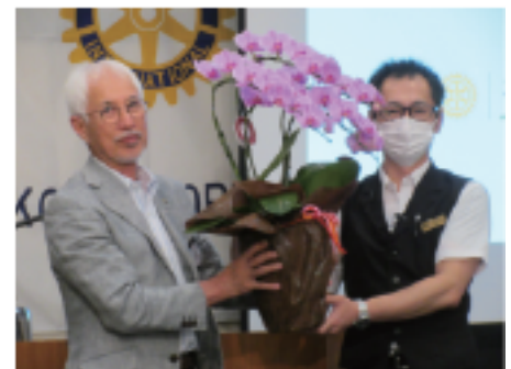
わがまま聞いてくれた 常磐ホテル様へ